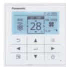
Dodatni upravljač Ožičeni daljinski upravljač CZ-RTCS