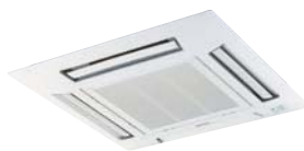
Ploča CZ-KPY3A (veličina 700 x 700mm) CZ-KPY38 (veličina 625 x 625mm)