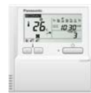
Dodatni upravljač Daljinski upravljač s brojačem vremena CZ-RTC4